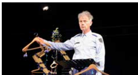
La nuit des brutes

Tout public, à partir de 14 ans Tarif : 4€ sur réservation auprès du Centre Culturel du Forum au 01 39 89 24 42