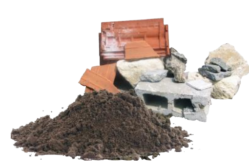
Matériaux de construction