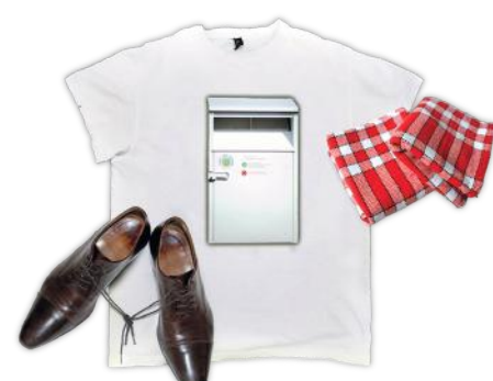
Textiles, linge, chaussures