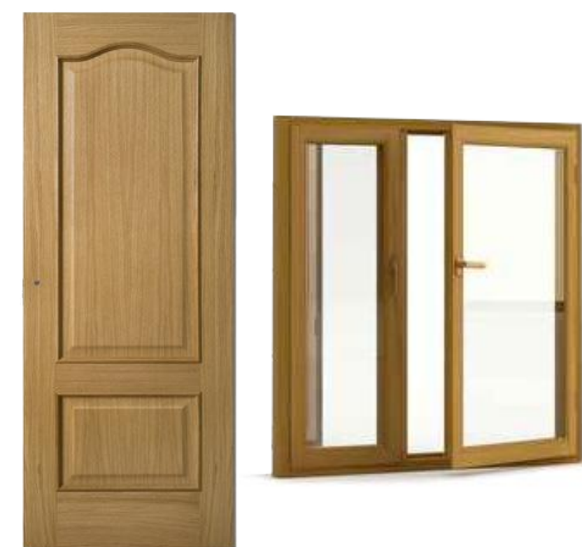
Portes et fenêtres