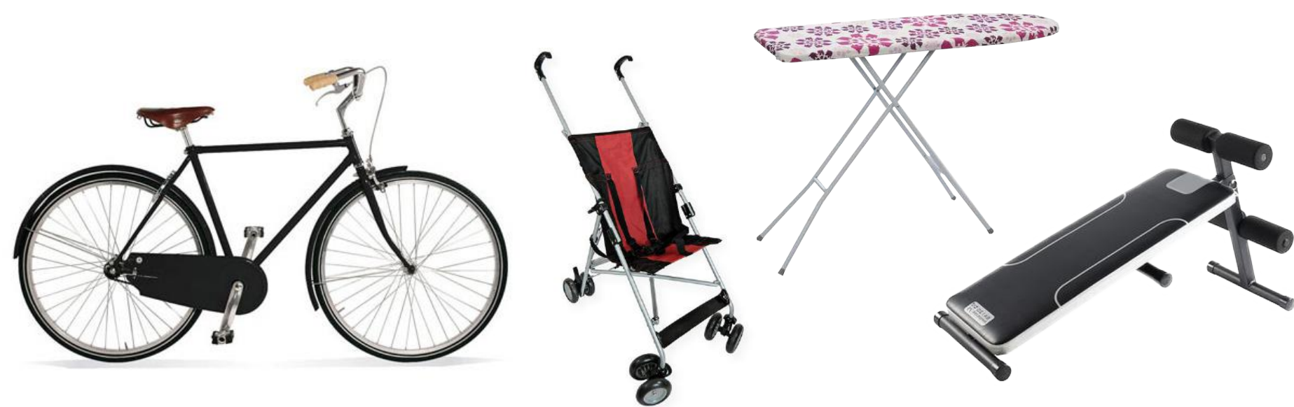
Grands objets en métal