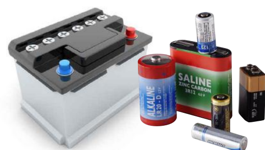
Batteries et piles