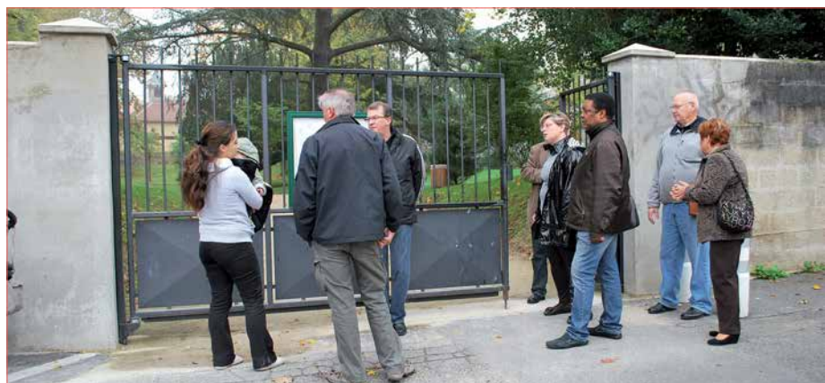
Entrée/sortie du parc Marie-Dominique Pfarr

Dans cette partie de la ville, les préoccupations communes étaient surtout liées aux chantiers de construction immobilière en cours ou sur le point de s'achever. Et tout d'abord, l'afflux de nouveaux foyers, avec inmanquablement un flot de véhicules à stationner, même si des parkings en sous-sol sont prévus. C'est pourquoi le parking provisoire de la rue Chaussée va faire l'objet de travaux de rénovation et même d'agrandissement à hauteur de 60 places. Il faudra encore un peu de patience pour tous les travaux de réfection de voirie,