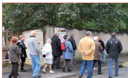
Parking de la rue Chaussée

d'aménagement de trottoirs qui ne pourront se faire qu'après l'achèvement des logements. Tout comme pourra s'engager alors une vraie réflexion sur les sens de circulation des rues.