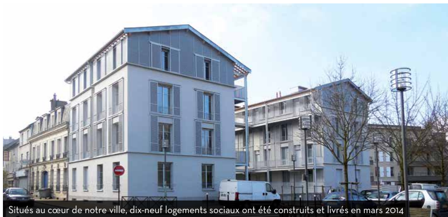
Situés au cœur de notre ville, dix-neuf logements sociaux ont été construits et livrés en mars 2014

Il s'agit de la Loi Duflo, remaniée par la ministre Sylvia Pinel. Elle la complète en supprimant la notion de COS (Coefficient d'occupation des sols) et le minimum parcellaire pour qu'un terrain soit constructible. La densification des zones urbaine est confirmée.