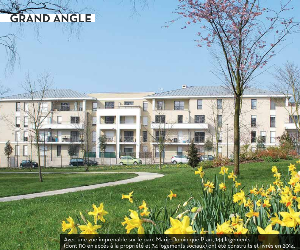
Avec une vue imprenable sur le parc Marie-Dominique Pfarr, 144 logements (dont 110 en accès à la propriété et 34 logements sociaux) ont été construits et livrés en 2014.