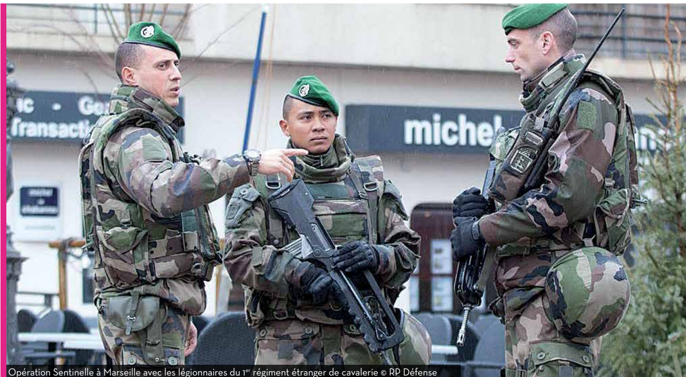
Opération Sentinelle à Marseille avec les légionnaires du 1 er régiment étranger de cavalerie

Les attaques terroristes, qui ont visé notre pays au début de l'année, ont obligé le Gouvernement à relever au niveau le plus élevé le plan Vigipirate, échelon « Alerte- attentat » afin de faire face à une menace imminente.