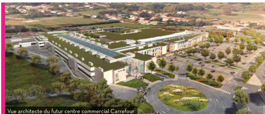
Vue architecte du futur centre commercial Carrefour

Les travaux au centre commercial Carrefour font l'objet de certaines rumeurs, entre cinéma et autres boutiques, la rédaction vous en dit plus sur le chantier en cours.