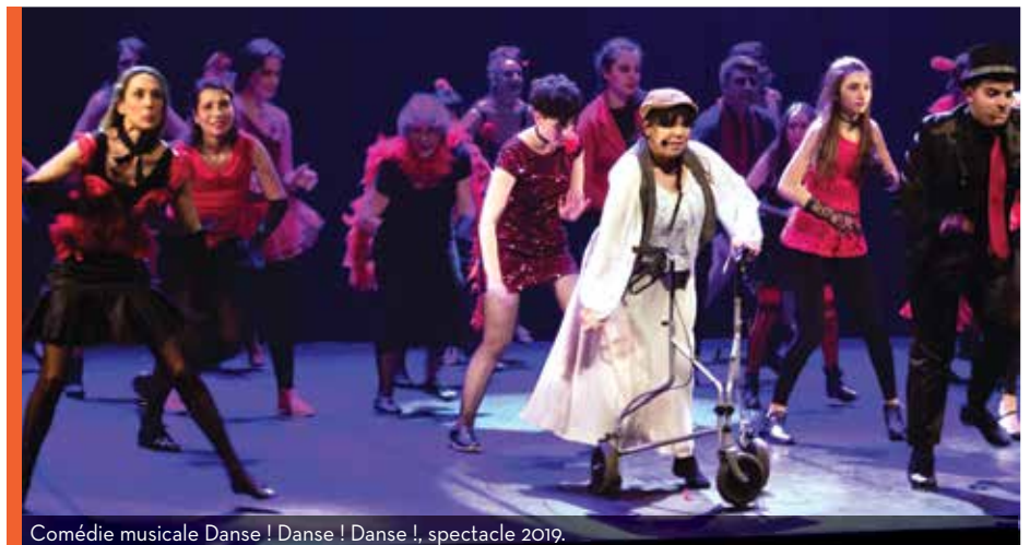
Comédie musicale Danse ! Danse ! Danse ! , spectacle 2019.

Sur scène, vous retrouverez plus d'une centaine d'artistes, issus de différentes troupes et associations, comme le FCA Danse, Art et Scène, Les Princesses du Nil, R' Mélodies Roissy, Connexions ou encore L'Entracte. Quant au spectacle, afin de ne pas gâcher la surprise, nous en dévoilerons