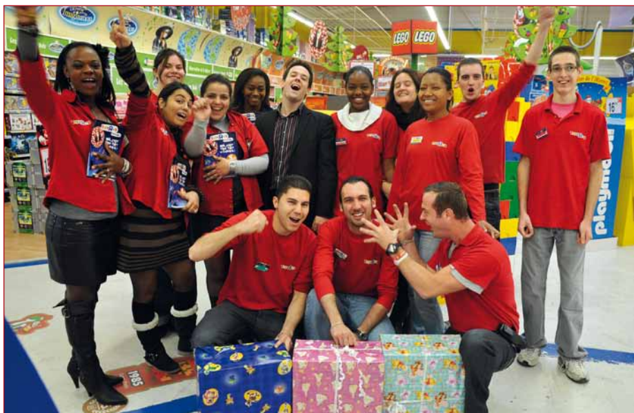
Une équipe jeune et dynamique pour vous accompagner dans vos achats.