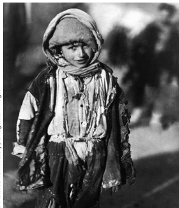
Arménie: Génocide. Arménien un réfugié arménien orphelin, 1918.