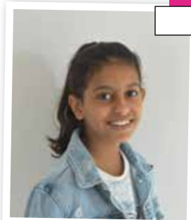
Lyna LLI École Jules Ferry