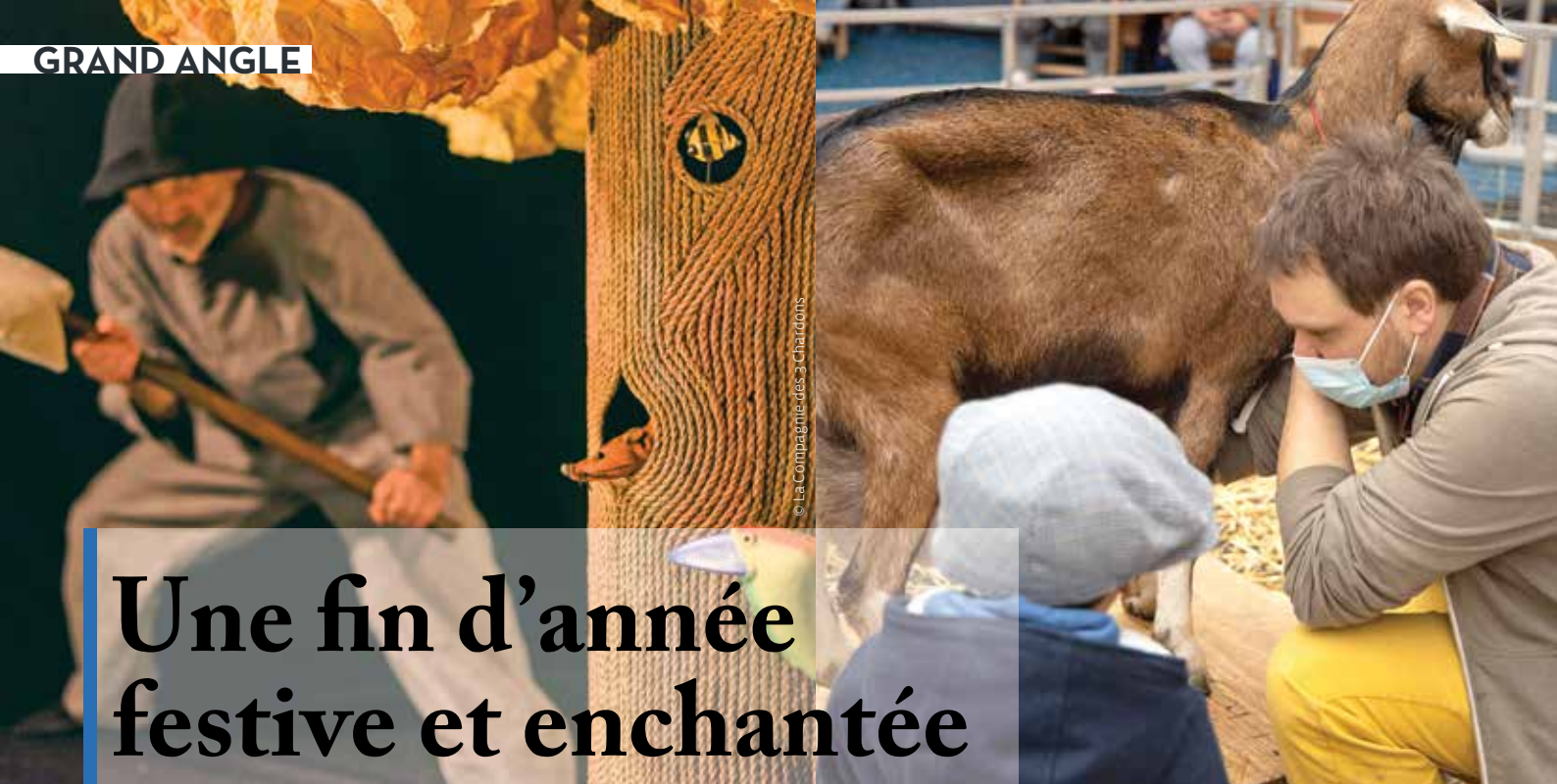
© La Compagnie des 3 Chardons