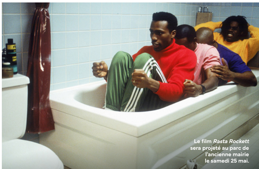
Le film Rasta Rockett sera projeté au parc de l'ancienne mairie le samedi 25 mai.

Saint-Brice-sous-Forêt accueillera, le samedi 25 mai, une séance de cinéma en plein air dans le cadre du festival de cinéma organisé par la Communauté d'agglomération Plaine Vallée.